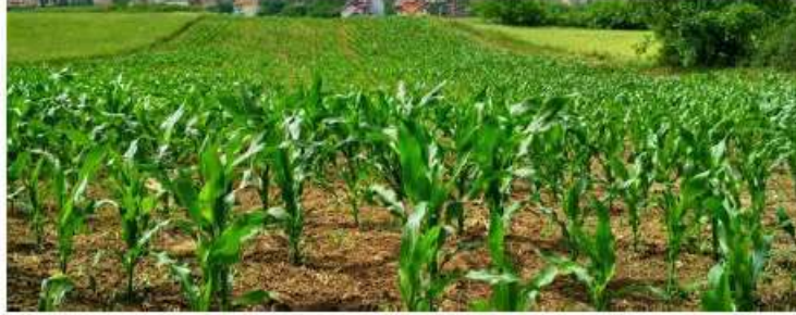
Principle 2: Good Agricultural Practice