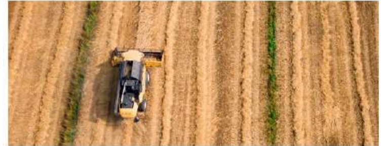
Principle 6: Good Management Practices and Continuous Improvement