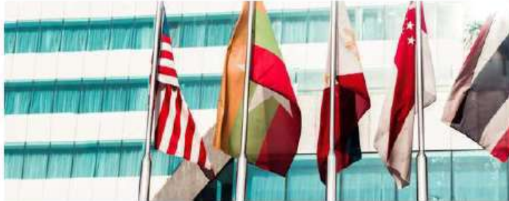
Principle 5: Compliance with Laws and International Treaties