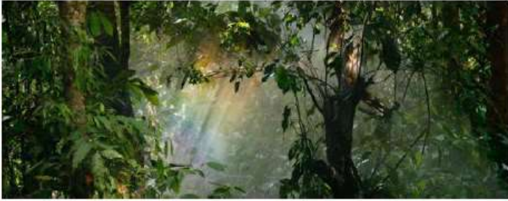
Principle 1: Protection of biodiverse and carbon rich areas