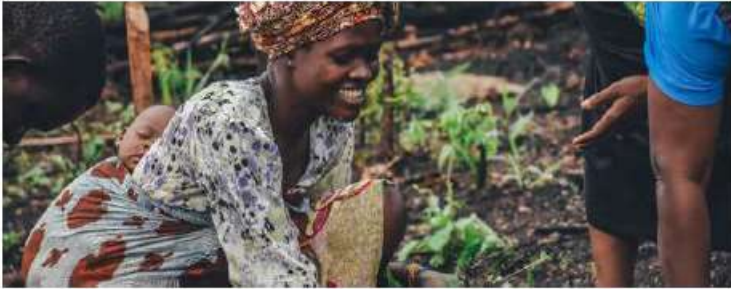
Principle 4: Compliance with Human, Labour and Land rights