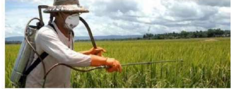
Principle 3: Safe Working Conditions